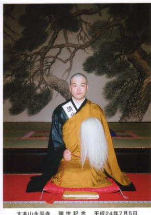
大本山永平寺 瑞世記念 平成24年7月5日

▼大本山永平寺と大本山總持寺への瑞世拝登を終了しました。「瑞世」は本山にて行う僧侶としての資格を得るための大切な儀式です。瑞世が終わると僧籍簿に登録、初めて和尚の法階と教師資格を得られる。